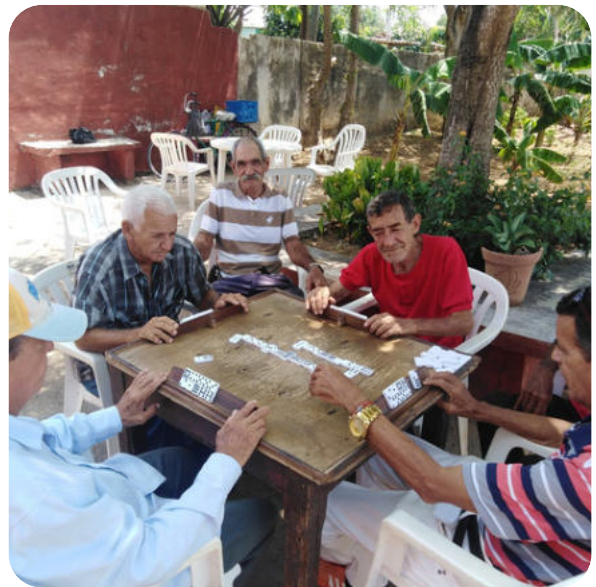
Stimuler l'activité cérébrale des personnes âgées par le jeu, l'une des activités réalisées dans les Casas de abuelos

Depuis 2018, un projet en faveur des personnes âgées s'est développé dans la ville de Colón 3 , au centre de la province. De ce travail ont émergé des protocoles et des guides qui font aujourd'hui référence non seulement à l'échelle provinciale, mais également au-delà. Ce projet a donné d'excellents résultats et une deuxième phase avait été envisagée. Celle-ci n'a toutefois pas pu être lancée, notamment en raison des répercussions de la pandémie. Les documents relatifs à cette nouvelle phase nous ont été présentés récemment et nous sommes convenus de l'initier encore au cours de cette année, sous réserve des disponibilités financières. Cette phase visera en particulier à soutenir les proches aidants, tant par le biais d'outils technologiques que par la mise à disposition de guides pratiques.