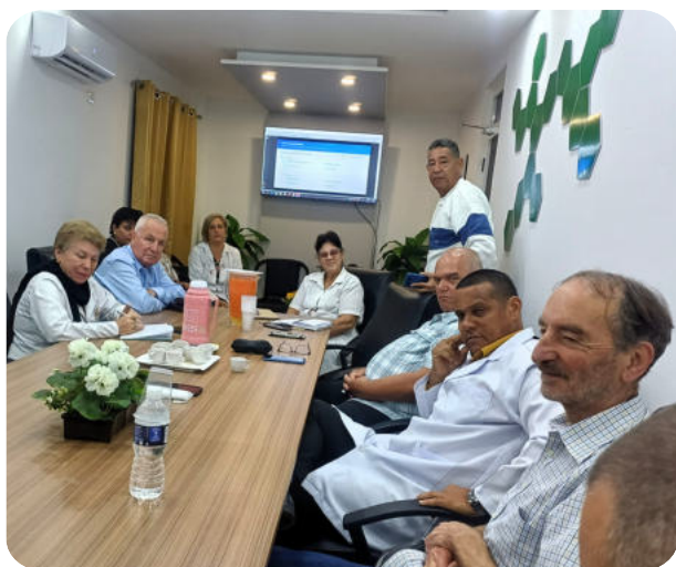
Réunion avec la direction de l'Hôpital Antonio Luaces Iraola : discussion sur la situation actuelle et des défis qu'il faudra relever ensemble

Face à ce constat, nos collègues nous ont présenté un projet de détection précoce des cancers digestifs par le biais du dépistage. Bien que cette proposition nécessite encore une élaboration plus précise, nous en avons accepté le principe. Une collaboration avec l'hôpital de Matanzas a par ailleurs été initiée afin de renforcer les équipes.