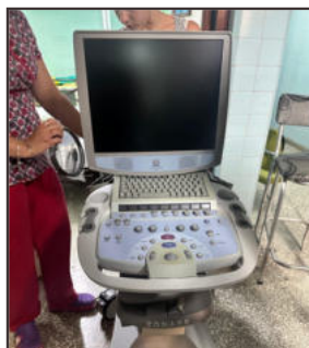
L'arrivée du matériel et équipement médical est toujours une source de joie et d'espoir pour le personnel de l'hôpital

La partie la plus importante de la visite a été consacrée à l'Hôpital Faustino Pérez 4 , où le « Groupe Matanzas Suisse », animé par plusieurs professionnels de la santé de Suisse orientale, a apporté une contribution majeure. Celle-ci s'est traduite par l'envoi de matériel médical par conteneurs — onze à ce jour ! — ainsi que par des actions de formation et d'accompagnement visant à l'introduction, au développement et à la récupération de techniques et de technologies.