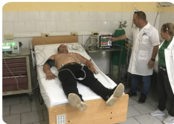
Policlinique Ciénaga de Zapata, pavillon des Urgences © mediCuba-Suisse, janvier 2025

L'installation récente d'un équipement de base moderne — moniteur, défibrillateur, pompes à perfusion et aspirateur — constitue une avancée importante, et les équipes médicales ont été formées à son utilisation. Il reste toutefois nécessaire de mettre en place une véritable formation continue en réanimation, appuyée sur des protocoles de prise en charge actualisés, afin de pouvoir exploiter pleinement ces instruments. Nous avons par ailleurs constaté l'état précaire, mais néanmoins accueillant, des installations. Afin d'améliorer de manière significative les capacités de diagnostic, nous nous sommes entendus avec le Groupe Matanzas pour l'envoi d'un appareil d'échographie moderne, un équipement susceptible de remplacer de nombreuses radiographies, entre autres. Cette visite fera l'objet d'un compte rendu plus détaillé dans l'un de nos prochains bulletins.