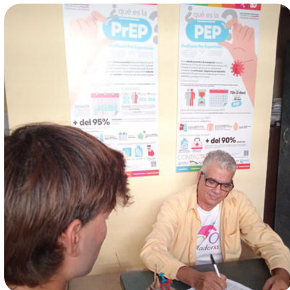
Les consultations de prévention et de suivi du VIH offrent une prise en charge globale des personnes vivant avec le VIH et des populations clés, afin de réduire les nouvelles transmissions et d'améliorer durablement la qualité de vie.